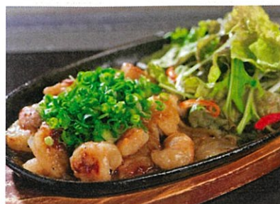
ホルモン鉄板焼き