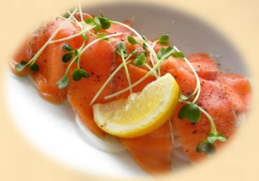
サーモンカルパッチョ